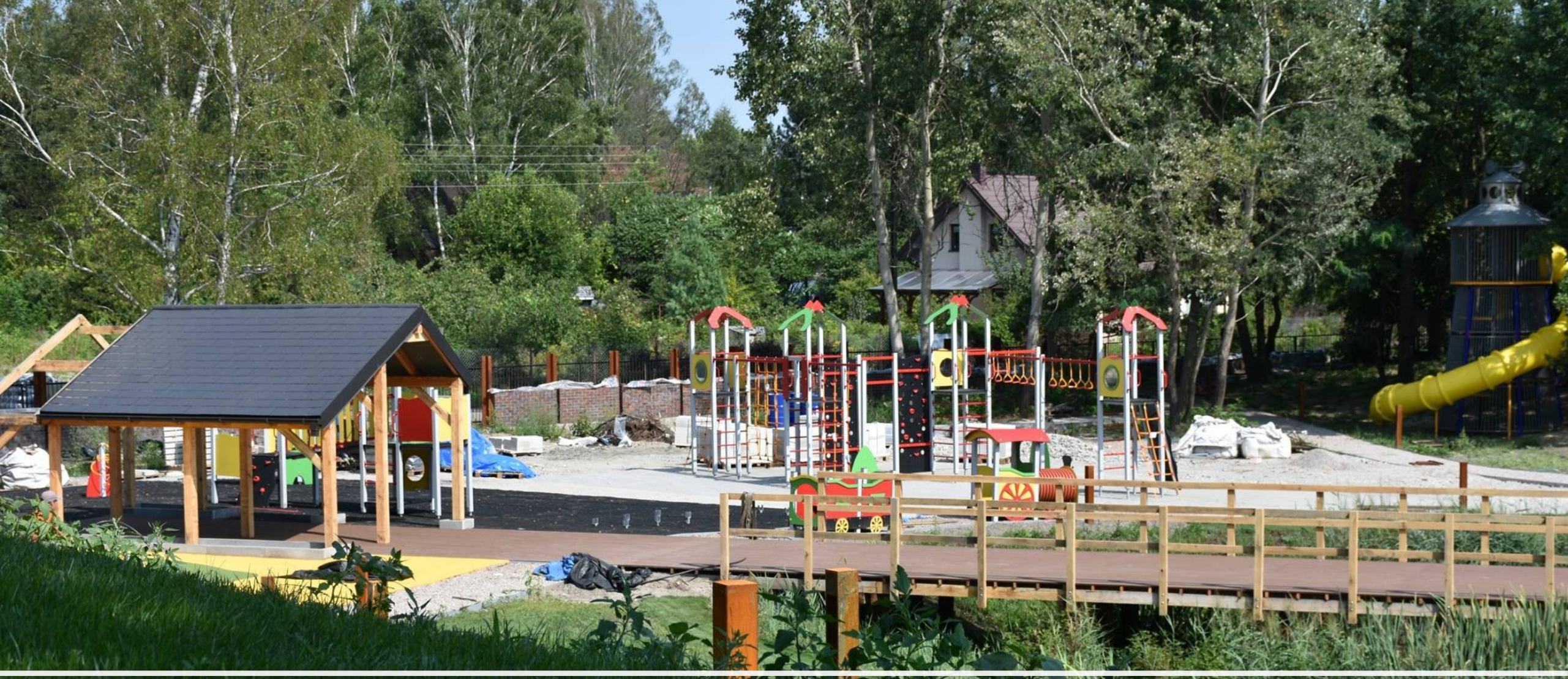
Park przy Muzeum im. Zofii i Wacława Nałkowskich