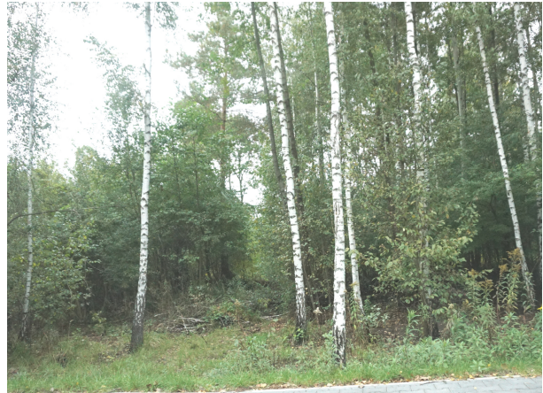
Las brzozowy w części wschodniej

W obszarze nie występują tu drzewa o parametrach pomnikowych ani szczególnie cenne ze względów gatunkowych i/lub krajobrazowych. Na omawianym terenie nie występują rzadkie gatunki i zbiorowiska roślinne. W większości są to gatunki pospolite dla terenów Polski, bądź niżu polskiego, mało wartościowe przyrodniczo.