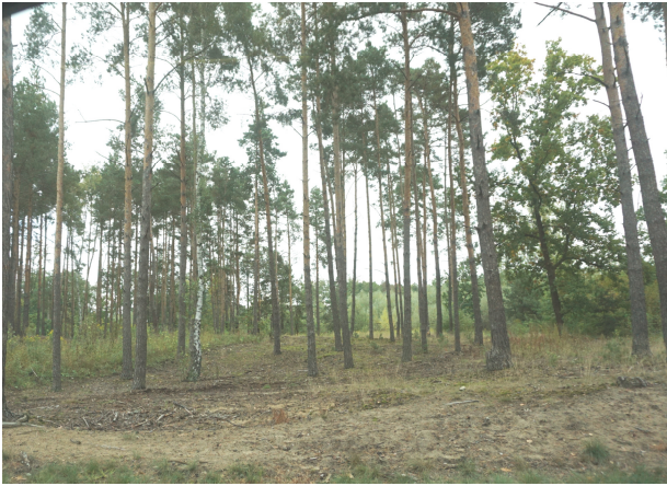
Las sosnowy w części zachodniej